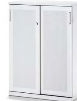
SCHIEBETÜRSCHRANK MIT AKUSTIKFRONT