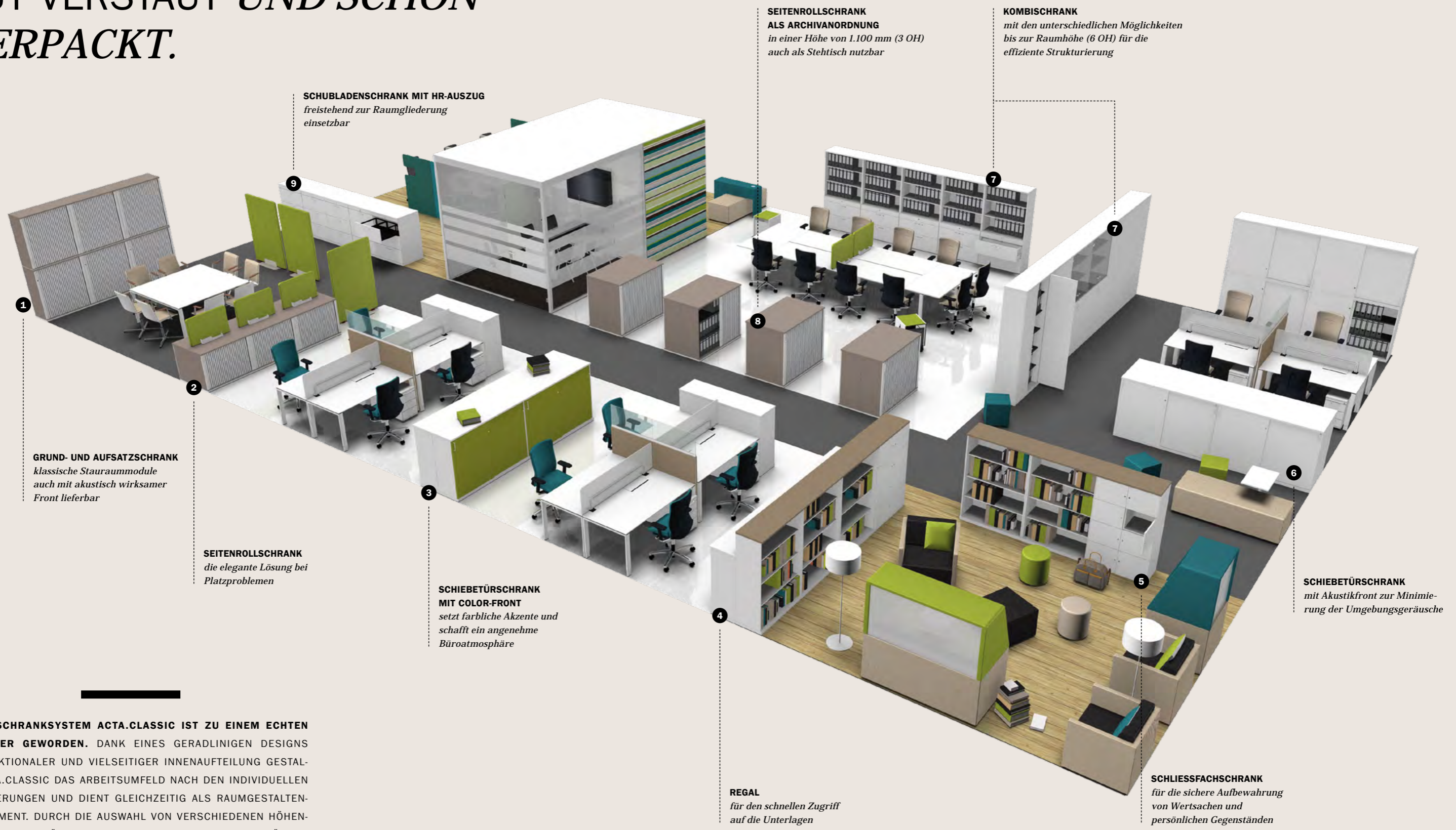
SCHUBLADENSCHRANK MIT HR-AUSZUG freistehend zur Raumlagerung einsetzbar