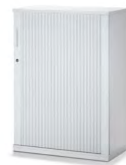
SEITENROLLADENSCHRANK MIT AKUSTIKFRONT