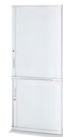
SEITENROLLADENSCHRANK MIT ZWISCHENSTÜCK