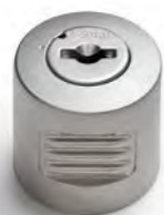
DREHOLIVE mit Schloss